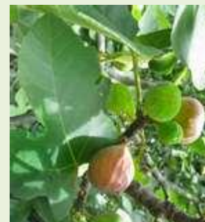
Trái sung ở Mỹ ( Ficus carica )

Trái sung giàu Phenol, axit béo, omega3 và omega6, tốt cho tim mạch.