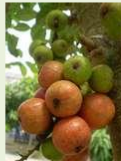
Trái Sung ở Việt Nam